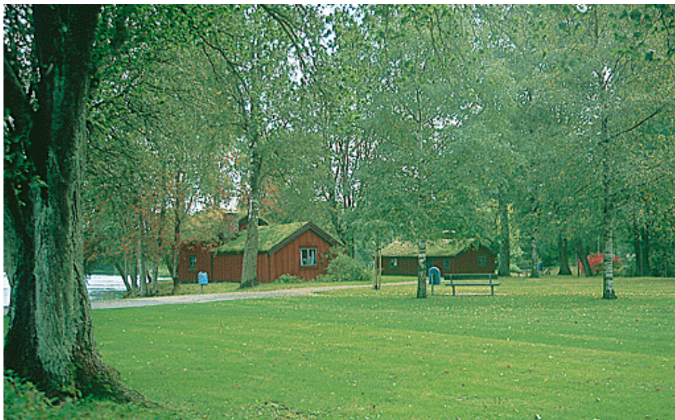
Hembygdsparken vid Lagan i Ljungby. The homestead park at Lagan in Ljungby. Freilichtmuseum am Fluss Lagan in Ljungby.